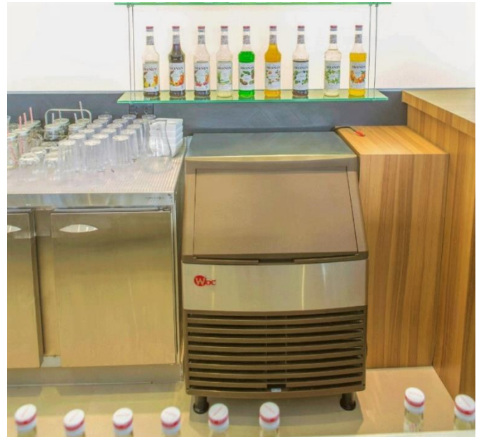
Máquina de gelo cubo WK73B-C