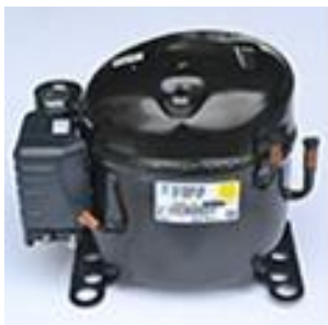
Bomba e motor do ventilador do compressor EBM-PAPST (Alemanha)

Venha para o mundo do gelo WOC e conheça além, de toda a qualidade, a exclusiva garantia total de 5 anos * e o gelo garantido WOC*