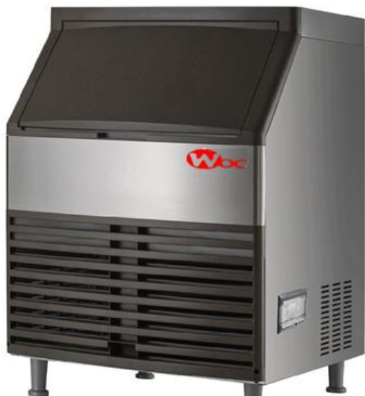
Máquina de Gelo cubo WOC95B-C

WK73B-C 73kg/24h WK95B-C 95kg/24h WK127B-C 127kg/24h