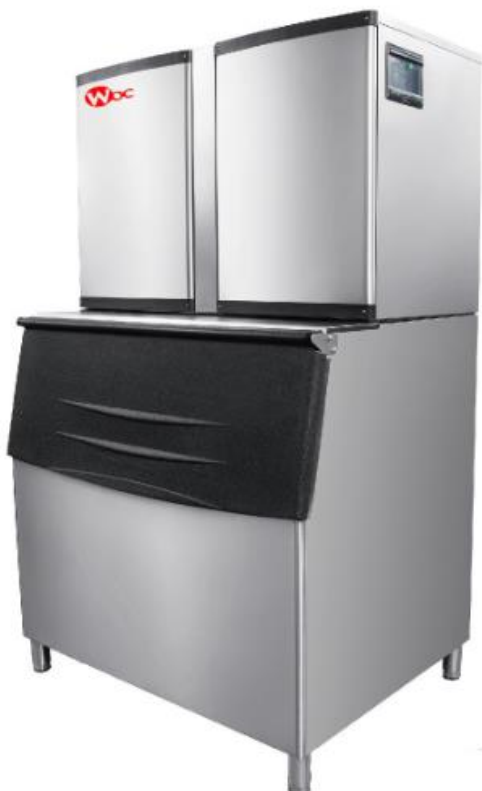
Máquina de Gelo cubo WOC159BM-C/B170

As máquinas de gelo WOC foram desenvolvidas exclusivamente para atender aos padrões de gelo do mercado nacional com os melhores componentes da indústria mundial. Nosso sistema patenteado de drenagem de água previne o acúmulo de sedimentos tornando o gelo mais cristalino, diminuindo a temperatura interna do gelo, prolongando o tempo de derretimento. O sistema opcional de esterilização através de lâmpada ultravioleta adiciona maior segurança alimentar ao gelo produzido.