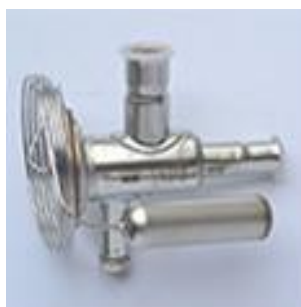
Válvula de expansão Danfoss (Dinamarca) controla com precisão e máxima eficiência o fluxo de gás refrigerante