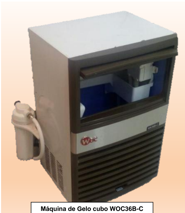
Máquina de Gelo cubo WOC36B-C

WK36B-C 36kg/24h WK55B-C 55kg/24h WK55B-C FLEX 55kg/24h