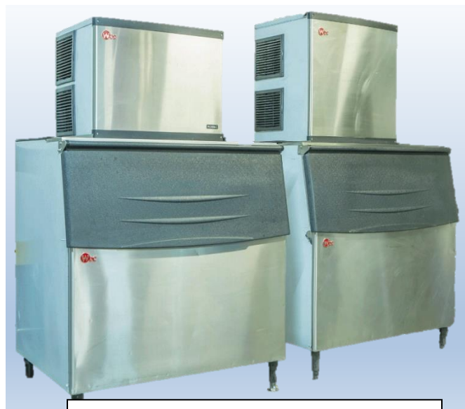
Máquinas de Gelo cubo WK318 E WK455BM-C com Bin B315