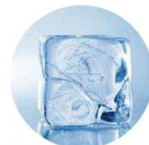
Formato do Gelo: 22mm x 22mm x 22mm 28mm x 28mm x 22mm 34mm x 34mm x 22mm 38mm x 38mm x 22mm

Venha para o mundo do gelo WOC e conheça, além de toda a qualidade, a exclusiva garantia total de 5 anos * e o gelo garantido WOC*