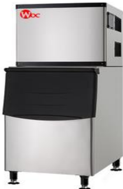
Máquina de Gelo cubo WOC318BM-C/B220

WK227BM-C 227kg/24h WK318BM-C 318kg/24h WK455BM-C 455KG/24H